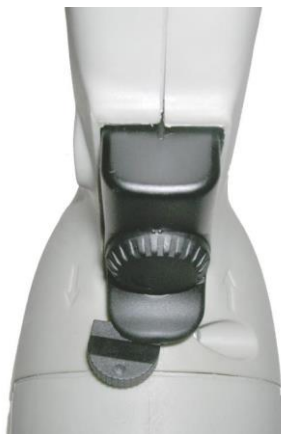
Рисунок 2. Положение переключателя направления вращения (реверс)

ВНИМАНИЕ! В целях предохранения вала гибкого с наконечниками от раскручивания переключатель направления вращения (реверс) на машине должен быть перевернут в положение, задающее вращение шпинделя в правую сторону (по часовой стрелке), смотреть рисунок 2.